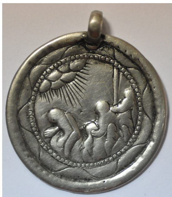
Рис. 5 та 7