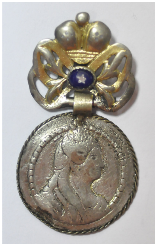
Рис. 1 та 2