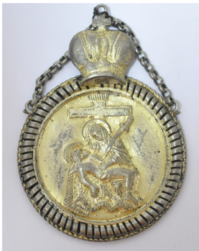
Рис. 3 та 4