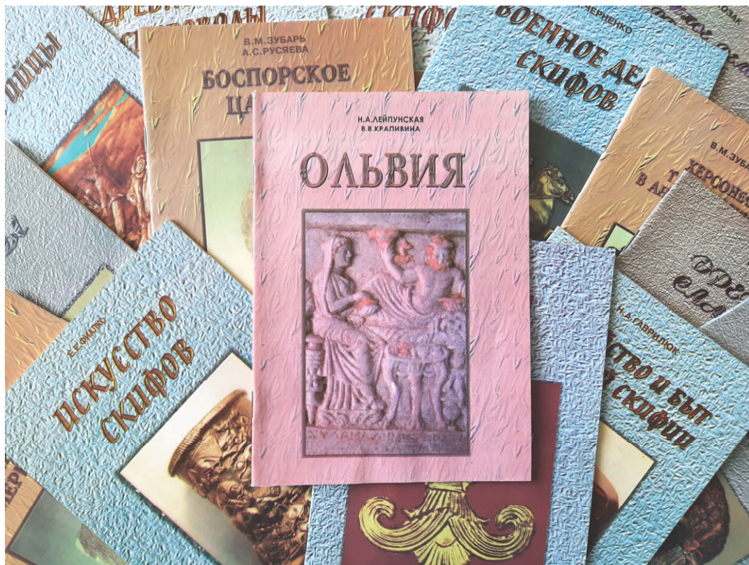
Рис. 3. Обкладинки науково-популярних брошур, що реалізувалися під час роботи виставки «Скарби Південної України»