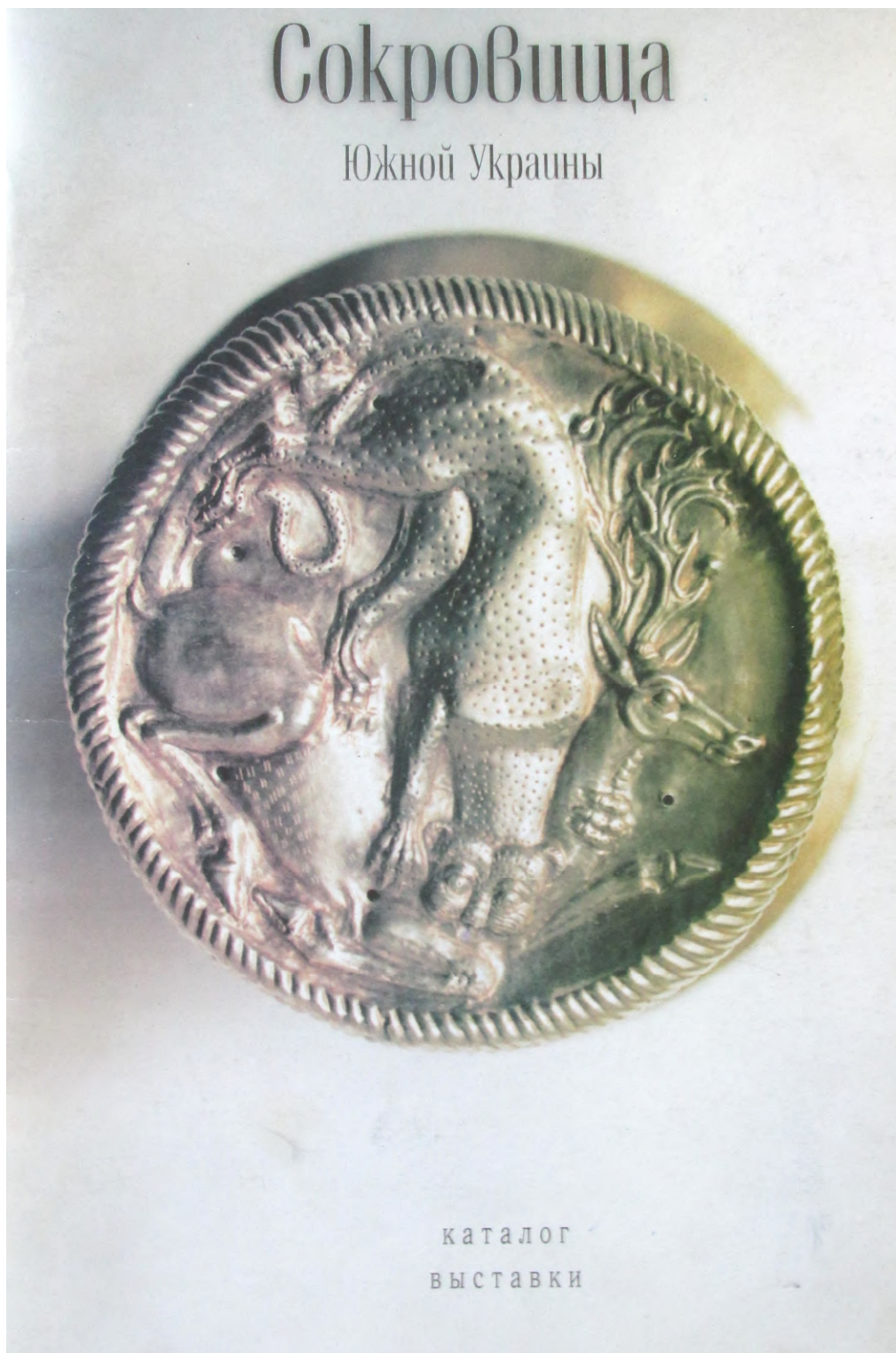
Рис. 1. Обкладинка каталогу виставки «Скарби Південної України»