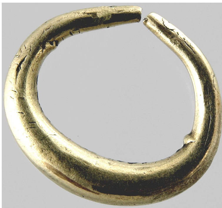
Рис. 11. Кільцеподібна серезка з поховання жінки в кургані № 2 (поховання 1) поблизу с. Таборівка (Миколаївська обл.). (АЗС 3478)