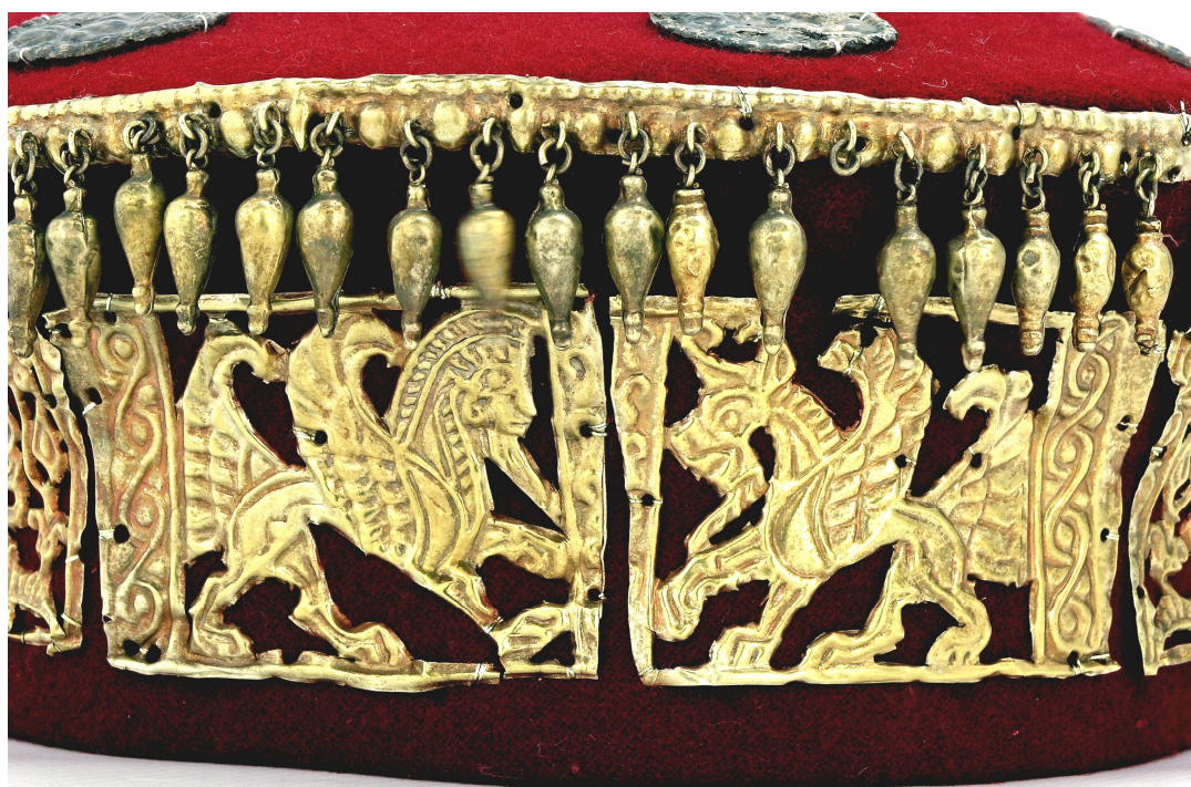
Рис. 1.3.а. Образ грифона, оберненого вліво; Рис. 1.3б. Зображення міфічної істоти з головою козла (в профіль вправо)