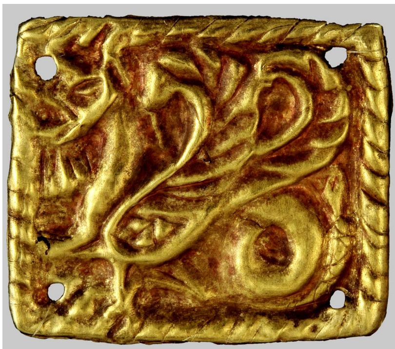
Рис. 4. Пластинка із зображенням дракона (курган 9, поховання 1 поблизу с. Піски (Миколаївська обл.) (АЗС 2724)