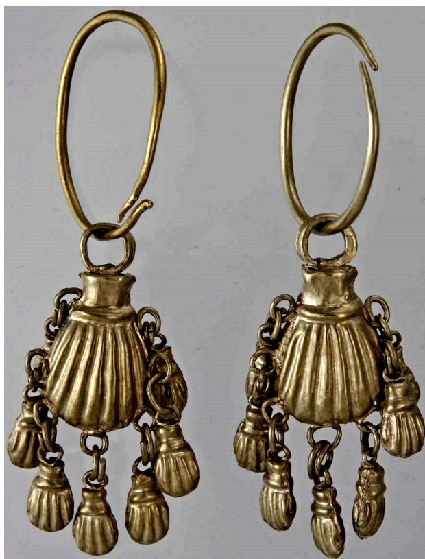
Рис. 9. Сережки з підвісками у вигляді мушель; курган 29 (поховання 1) поблизу с. Пришиб (АЗС 3567)