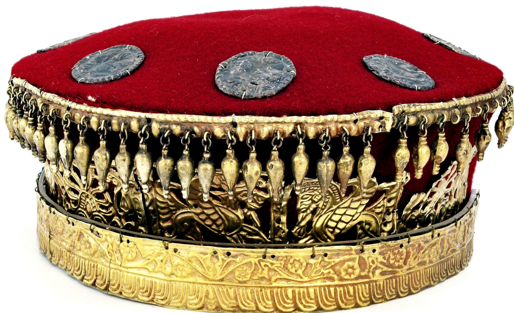
Рис. 1.7. Реконструкція головних уборів: модія з налобною стрічкою

Рис. 1. Золоті прикраси головного убору модія з поховання № 2 кургану 21 поблизу с. Кам'янка. Ажурні пластини (АЗС3232 – 3234).