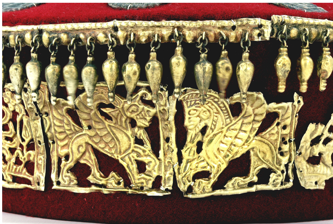
Рис. 1.4.а. Зображення грифона в профіль вправо; Рис. 1.4б. Образ монстра з головою козла (в профіль вліво)