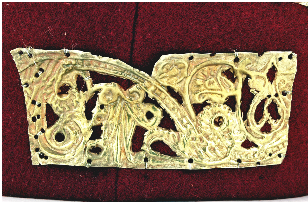
Рис. 1.2. Фрагмент візерунка