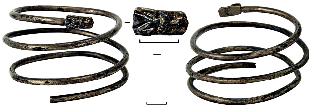
Рис. 6. Спіральний срібний браслет (АЗС 2726)