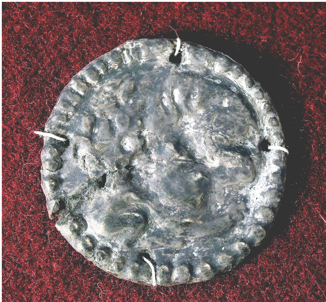
Рис. 1.5. Срібна пластинка із зображенням сцени шматування