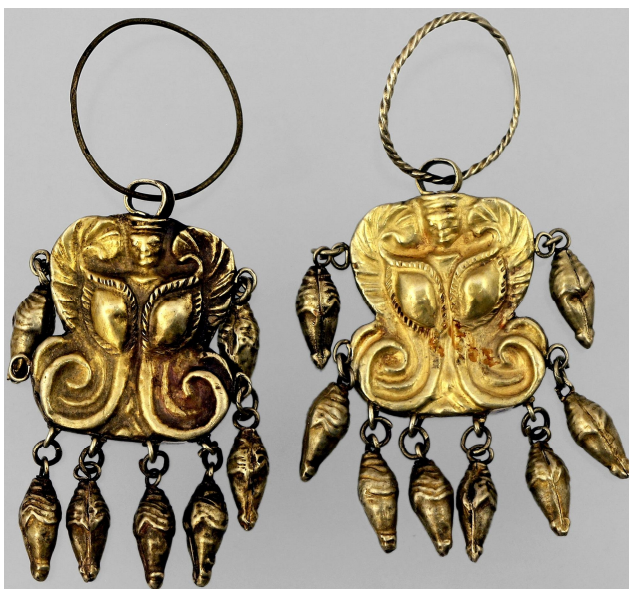
Рис. 8. Сережки із зображенням крилатого божества (АЗС 3839; курган 6, поховання 1 поблизу с. Мар'янівка Миколаївської обл.).