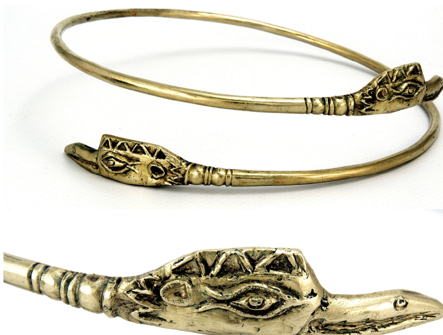
Рис. 5. Гривна із зооморфними закінченнями (АЗС 2727)