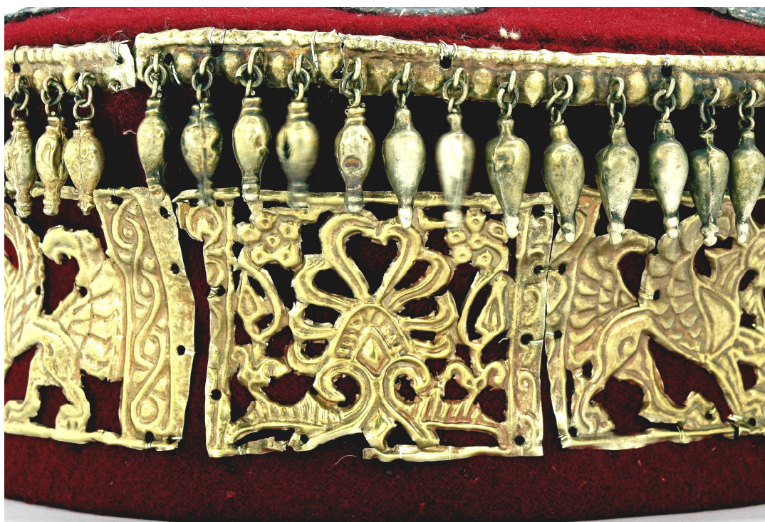
Рис. 1.1. Зображення пальметки.