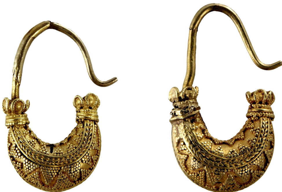
Рис. 10. Серезки – човники з поховання жінки в кургані № 2 (поховання 1) поблизу с. Таборівка (Миколаївська обл.). (АЗС 3477)