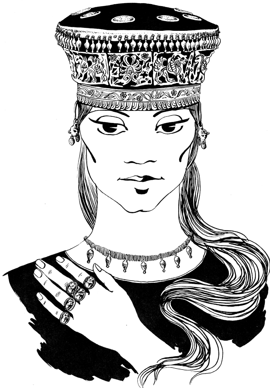
Рис. 3. Реконструкція костюмного комплексу з кургану 21 (поховання 2) поблизу с. Кам'янка (Миколаївська обл.)