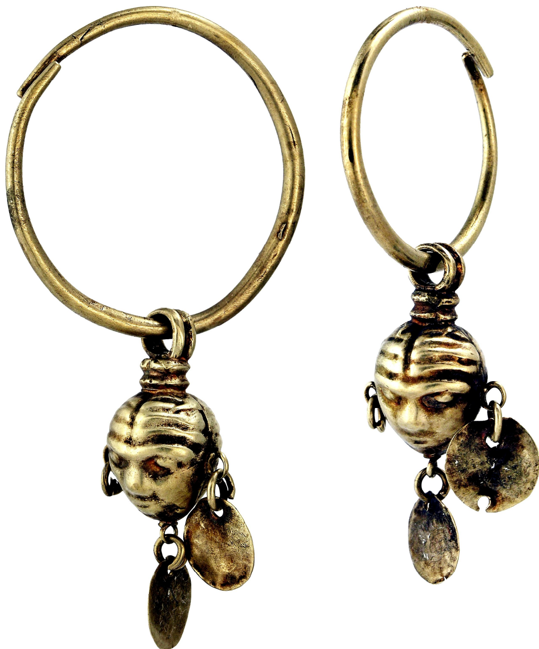
Рис. 2. Серезки з кургану 21 (поховання 2) поблизу с. Кам'янка (Миколаївська обл.) (АЗС 3235)