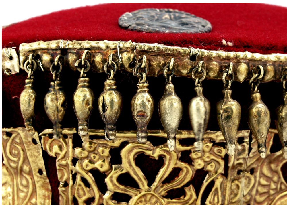
Рис. 1.6. Обідки з підвісками