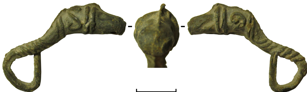
Рис. 1. Свинцева сережка з Ольвії

Хоча знайдена в Ольвії сережку можна віднести до цього типу прикрас, вона має деякі суттєві відмінності. По-перше, сережка виготовлена зі свинцю (відповідно до протоколу елементарного складу вміст цього металу складає 98,26%). По-друге, вона мала простіший спосіб виробництва: була відлита у двостулковій формі, на що вказують сліди затікання металу по межі стику половинок форми. З Ольвії походять декілька ливарних форм для кільцеподібних сережок з голівками лева або рисі на кінцях, а також декілька золотих сережок з лев'ячими головами.