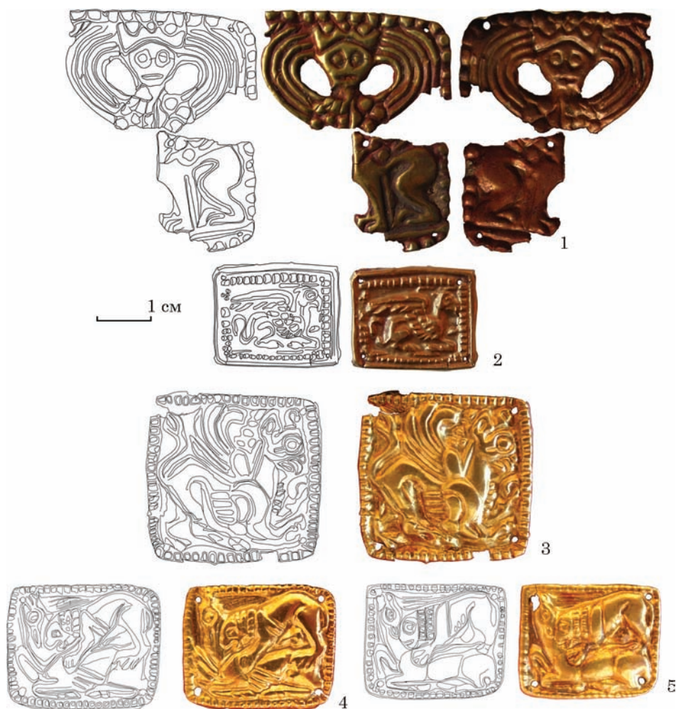
Золоті аплікації одягу з курганів біля с. Ольгине: 1, 2 — з Братолобівського кургану; 3—5 — з п. 4 к. 1 біля с. Ольгине

бічні елементи. Але не ясно, що вони позначають — головний убір, чи зачіску. Серповидні крила позначені п'ятьма вигнутими валіками кожне. Грудина істоти, або ж основа крил, позначені випуклими фігурами ромбів та овалів, подібних до орнаменту на головному уборі. По кутах виробу зберігся валік із псевдозерню, що оперізував виріб по підовальному контуру. У двох збережених кутах присутні отвори, пробиті з внутрішнього боку. Третій отвір (на тубі істоти), вочевидь, було нанесено додатково з лицьової сторони. Вірогідно, це було зроблено через пошкодження платівки і появи необхідності додаткового кріплення.