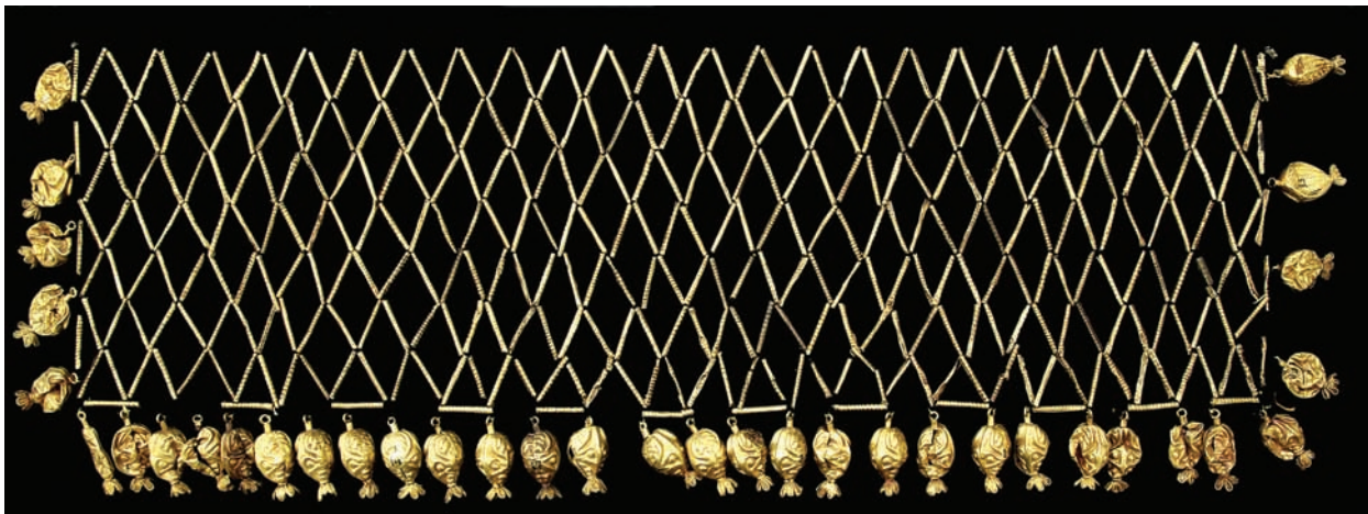
Рис. 1. Сітчаста нагрудна прикраса

образами; сюжетні зображення (Мурзин, Белан, Подвысоцкая 2017, с. 39).