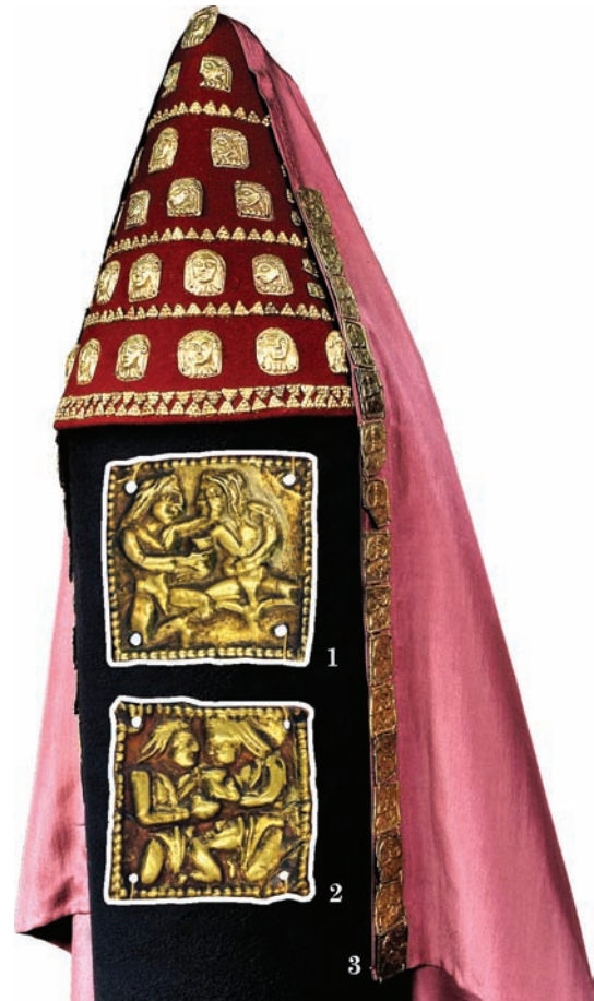
Рис. 3. Аплікації — прикраси покривала: 1 — зображення персонажа, який тримає ритон у правиці; 2 — пластинка із зображенням скіфів, які тримають ритон; 3 — реконструкція головного убору з покривалом

Ще один варіант штампа: скіфи сидять, зігнувши ноги так, що ступні з'єднані. Персонаж зліва обернений на три чверті, а обличчя подане строго в профіль. Волосся трохи скуйовджене, риси обличчя виразні, особливо виділено гачкуватий ніс. Скіф тримає у правиці ритон, а лівою рукою обнімає свого візаві. Персонаж справа сидить прямо, голова повернута вліво. Обличчя видовжене, облямоване пасмами прямого волосся, яке спускається до плечей. Ліва рука скіфа простягнута до посудини, але він її не торкається (рис. 3: 2). Сюжет найчастіше інтерпретують як ілюстрацію до розповіді Геродота про обряд братання (Геродот, IV, 70). Але зображення тільки у загальних рисах відповідає опису церемонії, яку, за свідченням Геродота, провадили скіфи. Ймовірно, зміст сцени варто «читати» в залежності від контексту. Семантику образів на аплікаціях з Бердянського кургану можна розкрити, зіставивши з аналогічними, зображення яких включено в багатофігурну композицію на так званій «пластині Гезе» — знахідці з кургану 2 поблизу с. Сахнівка (Черкаської обл.; Музей... 2004, кат. № 22, с. 377). Сахнівська пластинка (365 × 98 мм) була накладкою на фронтальну частину циліндричної шапочки, схожої на ту, що увінчує голову центральної особи в багатофігурній композиції, вміщеній на поверхні. Є кілька варіантів інтерпретацій сюжету. Деякі науковці вважають, що всі образи, показані на пластині, складають сюжет культово-міфологічного характеру — священний бенкет-жертвоприношення