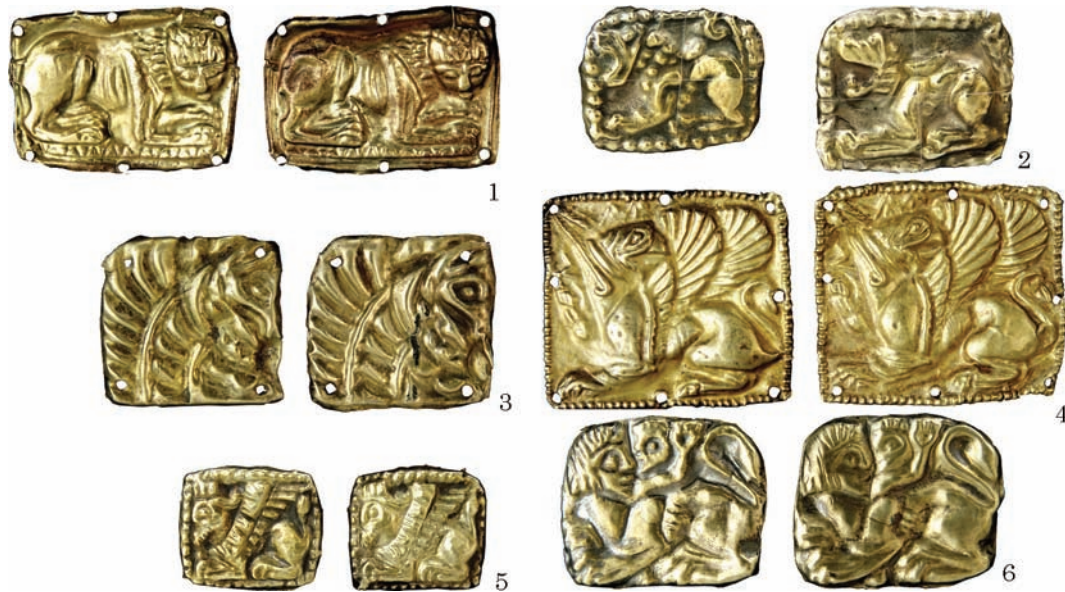
Рис. 5. Золоті пластинки із зображенням зооморфних і міфічних істот: 1 — образ лева; 2 — зображення левиноголового грифона; 3 — протома грифона; 4 — пластинки із зображенням грифона, оберненого вліво; 5 — образ грифона з рогом; 6 — сюжет у гротескному виконанні

рідні: вони відбивають цілий спектр уявлень про перехід з одного світу до іншого. Дослідники не раз відмічали різноманітні артефакти, пов'язані зі шлюбними обрядами у похованнях (Бессонова 1983, с. 115; Яценко 2006, с. 334, 354). У шлюбному ритуалі велике значення мав червоний колір. Він, ймовірно, викликав різноманітні асоціації — кров, вогонь, сонце, тобто, життєдайні образи (Яценко 2006, с. 360, 361).