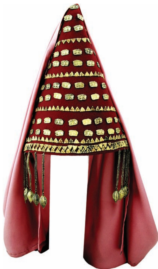
Рис. 4. Головний убір з підвісками

звана «сцена братання» — скіфи з ритонем (рис. 3: 3). Але є відмінність у образному та ідейному наповненні обох композицій: Сахнівської і Бердянської. Йдеться про дзеркало: його зображення нема на фронтальній площині головного убору, крім того, не зафіксовано і серед речей у «схованці». Отже, можливо, декоративні елементи, насамперед, прикраси головного убору, є символами не Аргімпази, а іншого божества життєдайних сил природи — Кібели. Образ хижака з породи котячих, включений до набору оздоб убору, акцентує саме це божество. Символічними є форма убору: алюзія на гору — еквівалент дерева життя, а також оформлення фронтальної частини убору і в сенсі форми — трикутник, і в сенсі змістовного наповнення: антропоморфні, зооморфні образи, геометричні мотиви — є знаками культів родючості (у широкому сенсі).