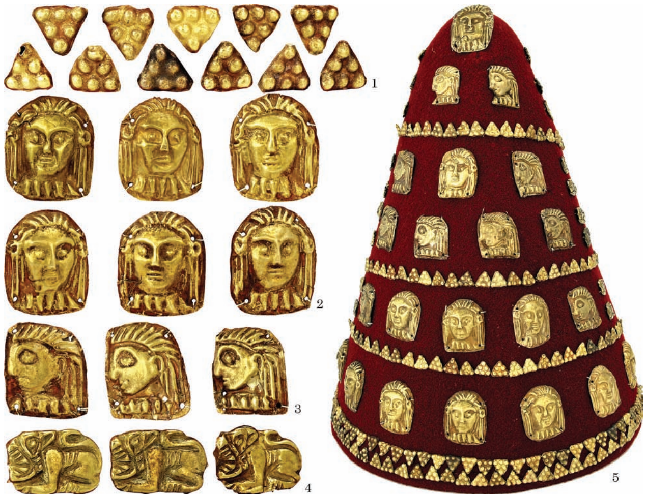
Рис. 2. Декоративні елементи — прикраси головного убору: 1 — пластинки-трикутники з пуансонними візерунками; 2 — портретні зображення анфас; 3 — портретні образи у гротескному стилі; 4 — образ хижака з породи котячих; 5 — реконструкція головного убору

користували для оздоблення золоті прикраси, на яких представлені «портрети»: на відміну від «масок» вони наділені деякими рисами індивідуальної характеристики. Вироби розрізняються між собою художніми особливостями, оскільки виконані за взірцями мистецьких витворів, які походять із кількох виробничих центрів, отже відбивають творчі засади різних майстрів. Трактівання жіночих образів у мистецтві Північного Причорномор'я здійснено у греко-скіфському стилі. Серед його характерних рис відзначимо своєрідне поєднання реалізму та примітивізму, гіперболізацію деяких деталей, оригінальне композиційне вирішення сюжетів. Н. Онайко підкреслила, що в творах «варварського» мистецтва особливо велику увагу приділяли зображенню голови (Онайко 1976, с. 173). Це доводять декоративні твори, на яких представлені «портрети» жінок. Мініатюрність виробів не вплинула на детальне відтворення жіночих голівок: вони у головних уборах, з нашійними прикрасами (Клочко 2019, с. 76—79). Більш рідкісними є «портрети», на яких жінки зображені з непокритою головою. Деякі з них узагальнені, нагадують маски.