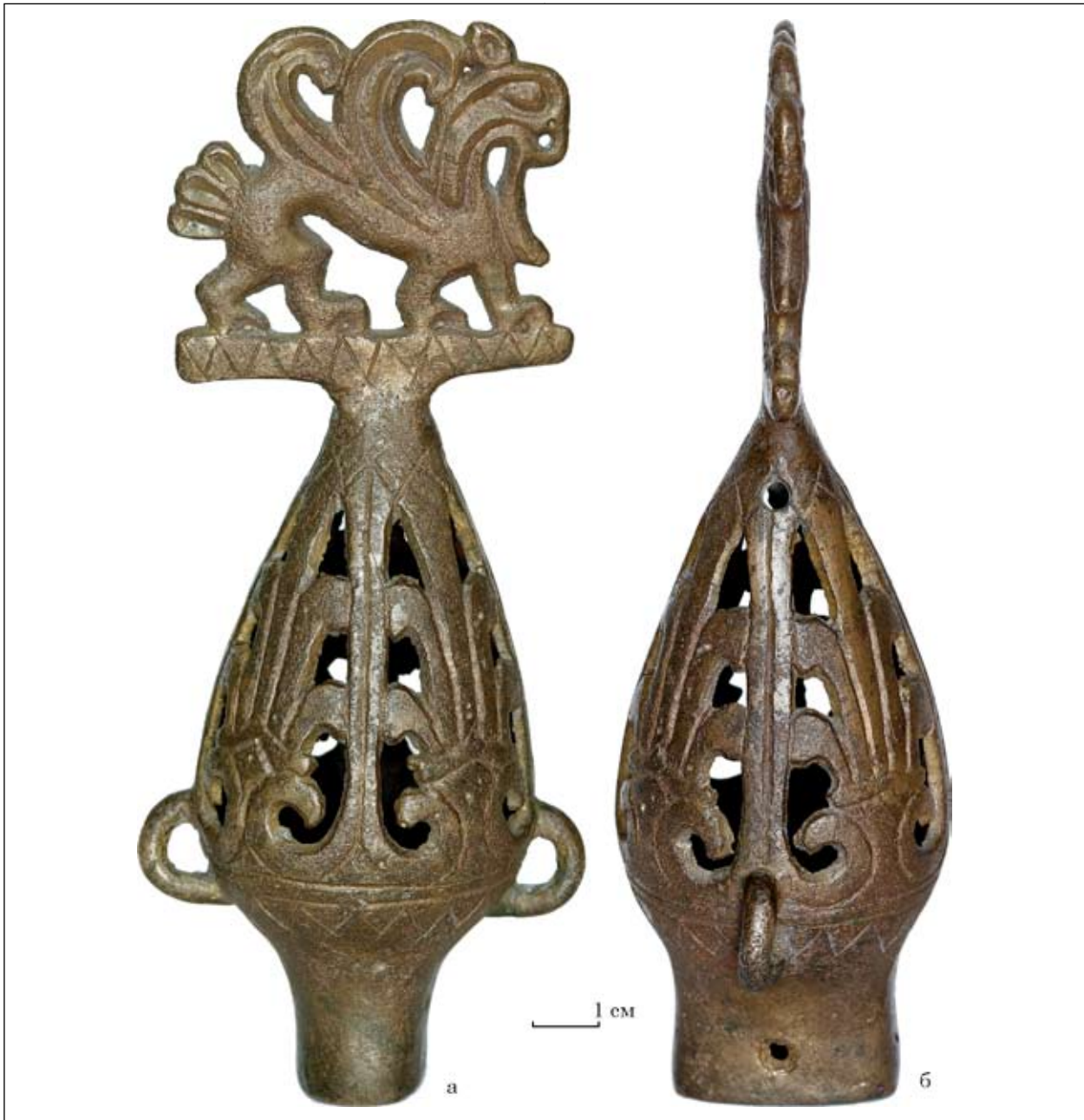
Рис. 1. Навершя з Чмиревої Могили (Арх-3795/3)

леними смугами. Усередині кожної з частин розміщений візерунок у вигляді витягнутої вгору п'ятипелюсткової пальметки. Нижня частина «груші» обмежена двома врізаними концентричними лініями, від яких опускаються врізані трикутники вершинами донизу, утворюючи зигзагоподібний візерунок. Такий же орнамент з ламаних ліній обмежує верхню частину «груші». Тут, по тій лінії, що і петлі, розташовані, навпроти один одному, два круглих отвори діаметром 0,4 см. В одній частині візерунка, поруч з отвором, виділяється хресто-подібна фігура.