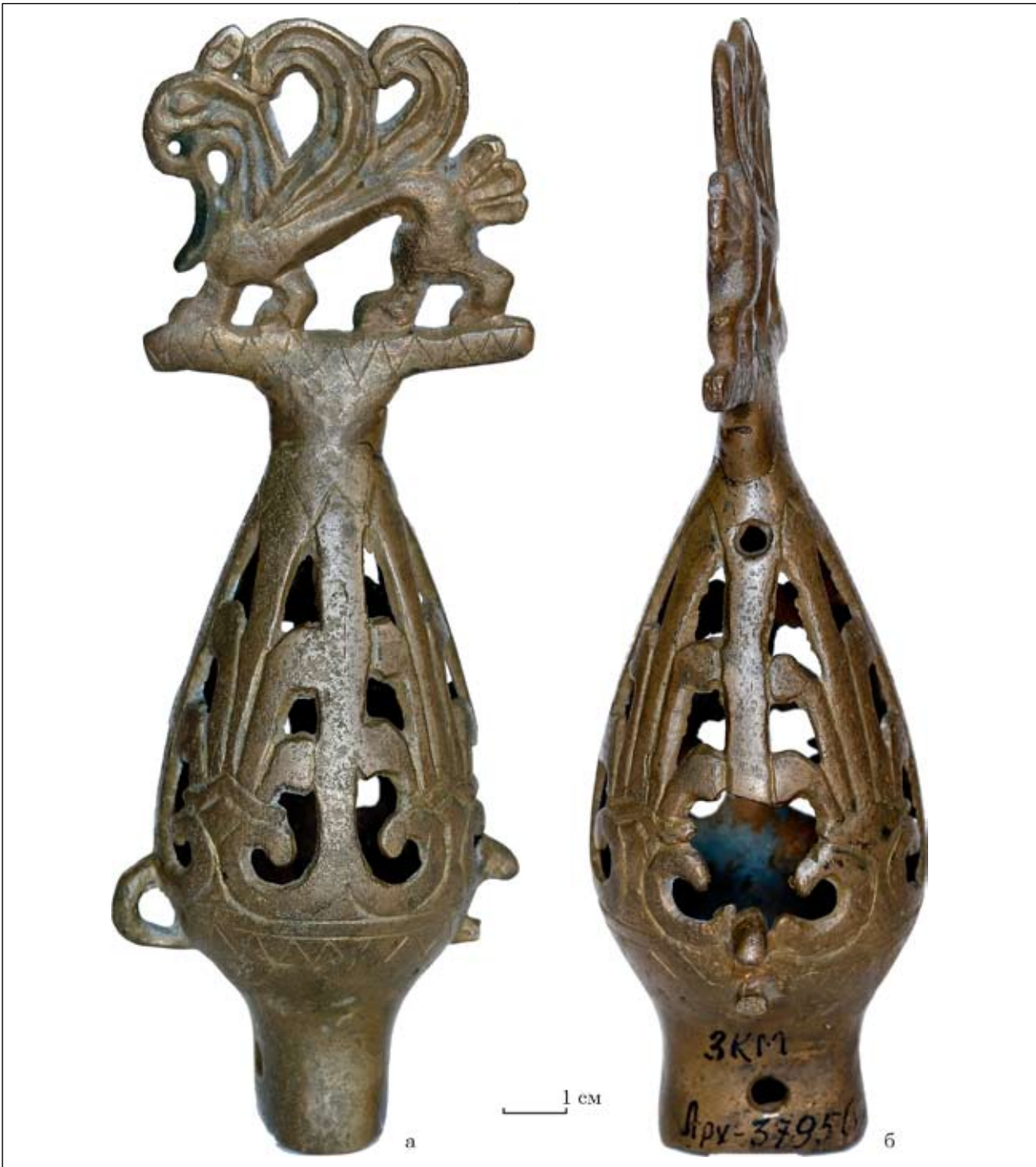
Рис. 3. Навершя з Чмиревої Могили (Арх-3795/1)

на довгих сторонах втулки, мають розміри 0,5 і 0,4 см. Перекладина разом з грифоном має довжину 6,0 см, висоту 0,7 см, ширину 0,2 см. Висота самого грифона — 4,8 см. Фігурка грифона майже ідентична № 1. Є невелика різниця в оформленні деяких деталей: на задній лапі немає гострого виступу, вухо вужче, око більш витягнуте. Розділяє візерунки на тулубі гладка смуга. Збереженість виробу трохи гірша: одна петля, разом з вертикальною розділювальною смугою, що розташована знизу, обламана. У верхній частині бубонця, над отворами, що роз-