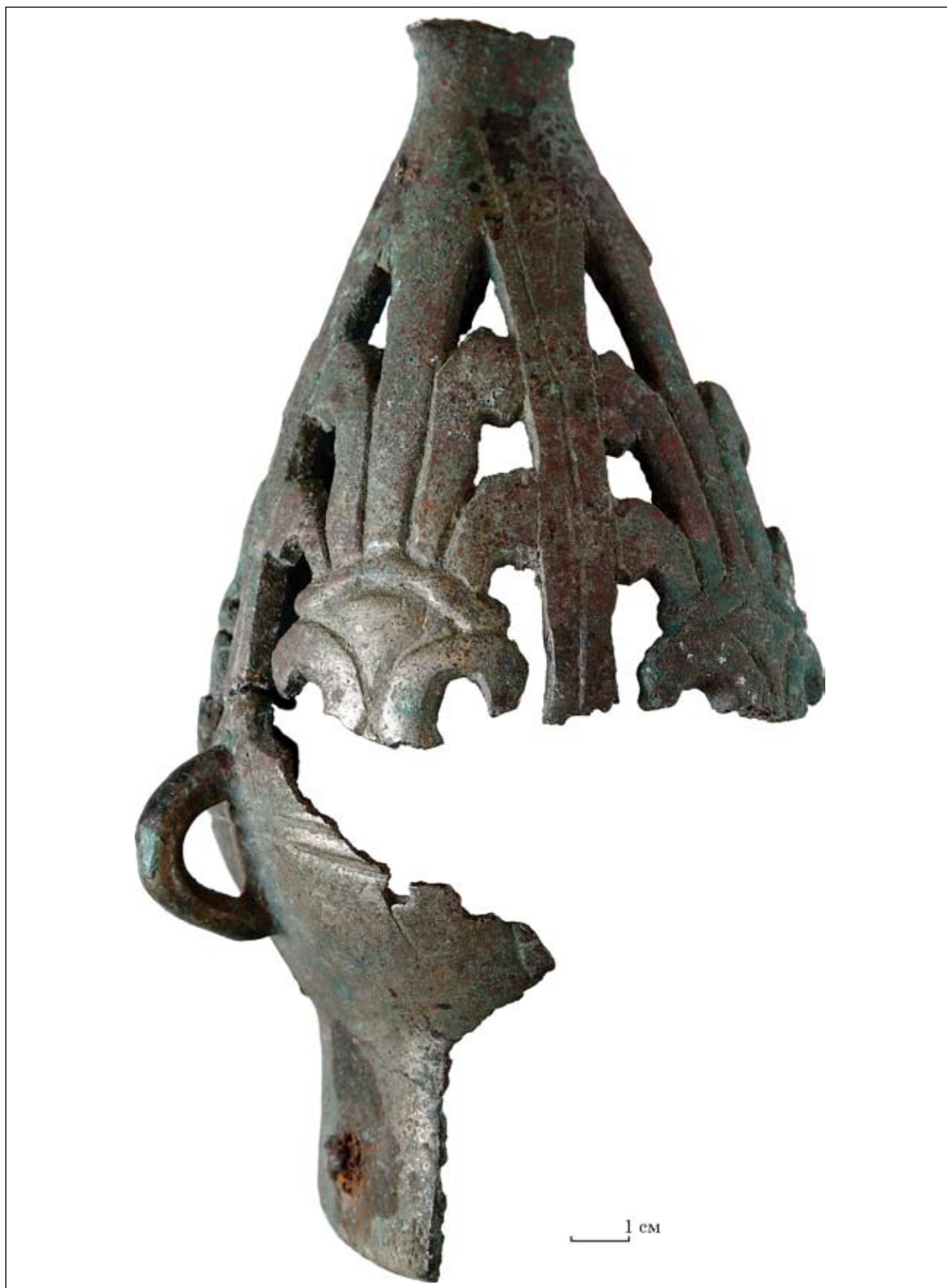
Рис. 4. Фрагмент навершя з Гайманової Могили (Арх-1020)

Цей екземпляр був знайдений в уламках. У колекцію Запорізького обласного краєзнавчого музею надійшли лише два фрагменти грушо-