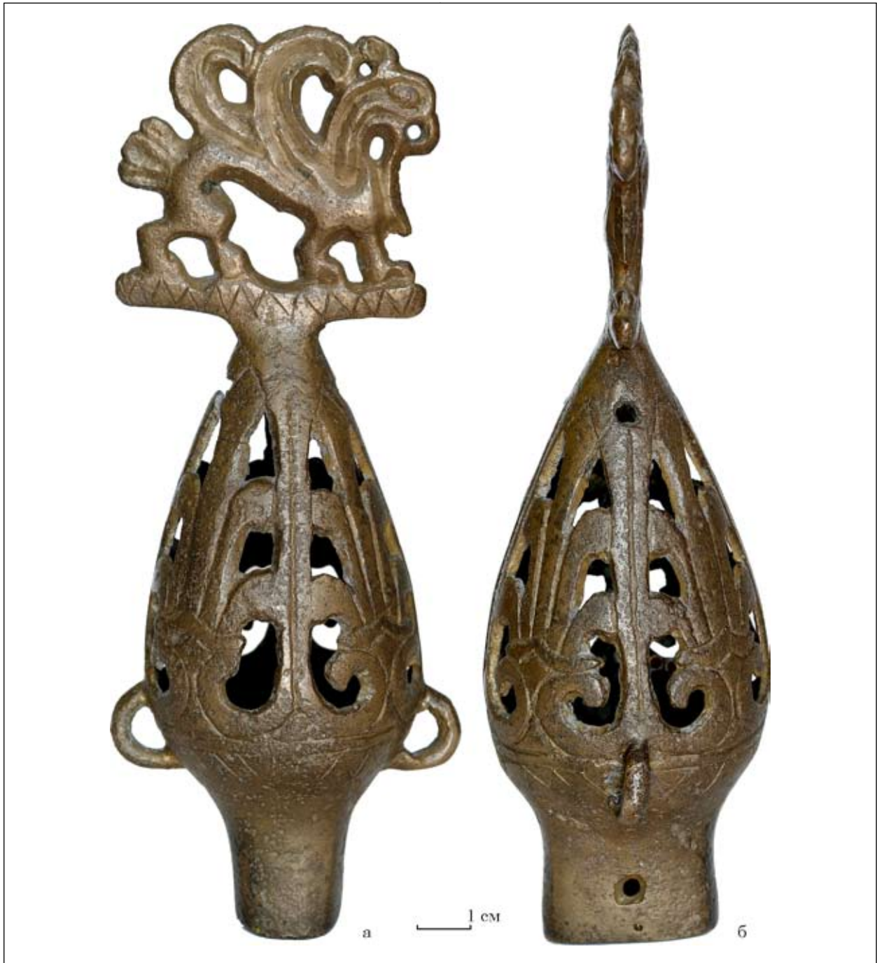
Рис. 2. Навершя з Чмиревої Могили (Арх-3795/2)

Навершя 2. Друге навершя, під номером ЗКМ-Арх-3795 (2), має висоту 17,3 см, найбільший діаметр бубонця — 5,5 см. Розміри поперечини, на якій стоїть грифон, складають 6,0 \times 0,6 \times 0,3 см. Висота самої фігурки — 4,7 см. Втулка прямокутна, по краю сплющена, внутрішній розмір — 2,8 \times 1,6 см, зовнішні — 3,3 \times 2,0 см. Внизу, по довгій стороні втулки, пробиті два круглих протилежних отвори, діаметрами 0,3 і 0,4 см. На одній з вузьких сторін є дугастий наскрізний отвір. Призначення його незрозуміле — чи то брак лиття, чи помилка розмітки отворів (?).