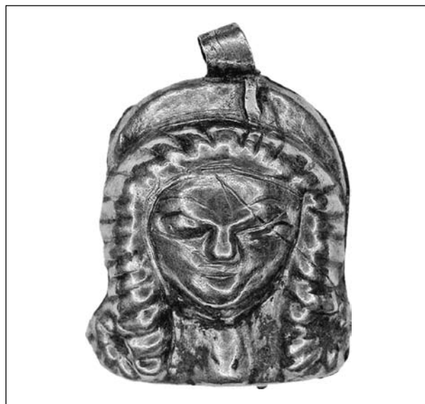
Рис. 2. Підвіска з п. 1 кургану 34 біля с. Софіївка (Ключко 2014)

Штамп 4 з колекції МА ХНУ має видовжену пірамідальну форму довжиною 53 мм; шири-