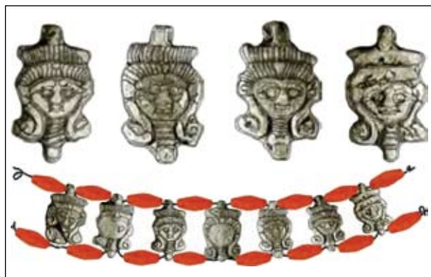
Рис. 11. Пронизки з амулетів із зображенням голови Хатхор (18 × 21 мм), Екрон (Палестина), XXI династія, XI—X ст. до н. е., Israel Museum, Jerusalem, N 86—22/1—7 (за: Herrmann 2016)

аналізу, ми можемо припустити, що на підвісках з кургану 34 біля с. Софіївка та на штампі з Кам'янського городища могли зобразити в такому іконографічному вигляді саме скіфську богиню Аргімпасу.