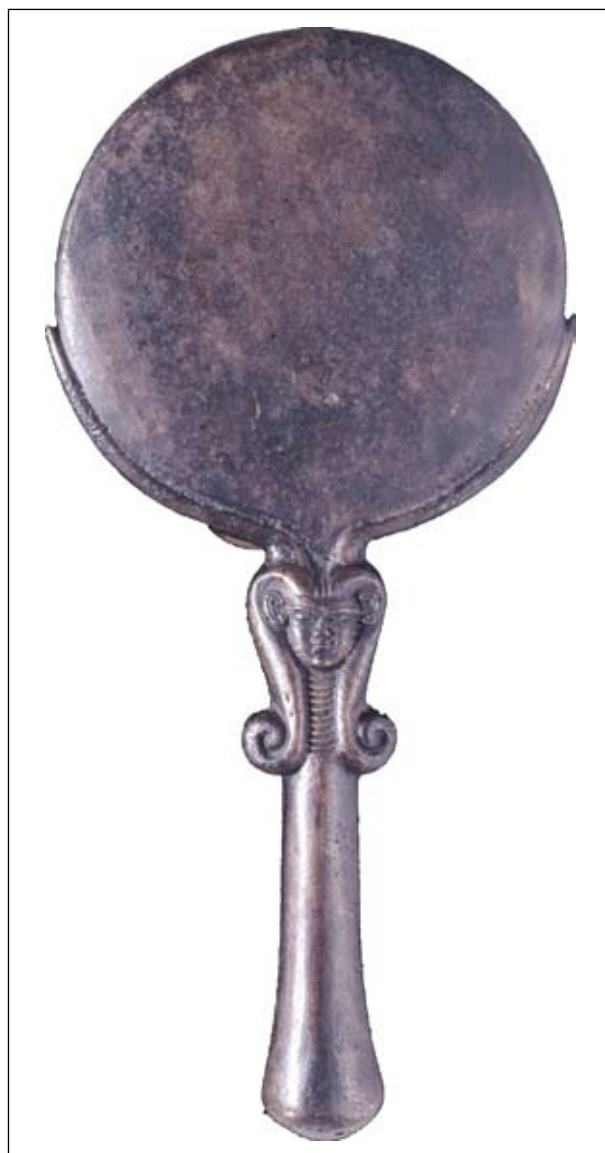
Рис. 7. Зображення голови Хатхор на руків'ї люстерка, Нове царство (London BM EA 29428); © Trustees of British Museum

увагу на золоту підвіску нагрудної прикраси із зображенням голови Хатхор у згаданій перуці з гробниці ССV некрополю II Маріона-Арсіної на Кіпрі, VI—V ст. до н. е. (знахідка 1886—1887 pp.) (Marshall 1911, p. 164 (1578); pl. XXVI) (рис. 8). Іншим зразком відтворення голови Хатхор на середземноморських ювелірних прикрасах є перстень фінікійської роботи (?) із зеленим яшмовим скарабеем у золотій оправі з гробниці 22 некрополя Тарроса (Італія), VIII—III ст. до н. е. (рис. 9).