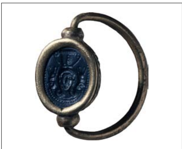
Рис. 9. Зображення голови Хатхор на перстні з Тарроса, VIII—III ст. до н. е., London BM EA 133860

Таким чином, образ богині в «хатхоричній перуці» міг проникнути до Північного Причорномор'я через посередництво еллінських майстрів як репліка образу «східної Афродіти», культ якої можливо, існував і в Причорномор'ї (Alexandrescu Vianu 1997, р. 15—32; Русяєва, 2005, с. 296 і сл.; пор. також: Кобылина, 1978, с. 118—119; 153, рис. 18).