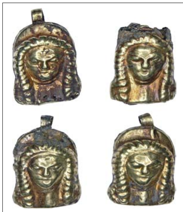
Рис. 1. Підвіски з поховання 1 кургану 34 поблизу с. Софіївка, Херсонська обл., IV ст. до н. е. (МКУ № АЗС—2754/1—4); © МКУ НМІУ (публікуються вперше)