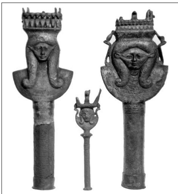
Рис. 6. Зображення голови Хатхор на руків'ях сестрів Римського періоду (London BM EA 65254, 38175, 6357)

Єгипту, але найважливішим і найдавнішим місцем її культу було м. Дендера (Bonnet 1952, S. 277—282; Daumas 1977, Kol. 1024—1033; Bleeker 1973; Leitz 2002, Kol. 75—79).