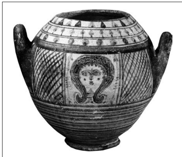
Рис. 10. Зображення голови «східної Афродіти» на амфорі з Малої Азії (Фокея або Міріна), VI—V ст. до н. е., London BM EA 1884,0209.2; © Trustees of British Museum