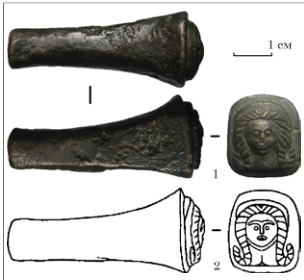
Рис. 3. Штмп з Кам'янського городища, випадкова знахідка, IV—III ст. до н. е.: 1 — фото (МА ХНУ № ВН 2089); © МА ХНУ; 2 — прорисовка за (Шрамко 1970, с. 219)

на чотирикутної площадки, по якій наносили удар молотком, складає 11 мм; прямокутна основа штампу має розмір 20 × 22,5 мм; випукле зображення голови жінки виступає над основою робочої частини до 8 мм. На жаль, витвори, що були зроблені з цього штампу досі не відомі. Проведений хімічний аналіз показав, що предмет виготовлено з олов'янистої бронзи, що окрім міді (Cu), містить близько 22 % Sn, 0,63 % Pb, 0,11 % Ni, а також сліди Zn і Sb (Шрамко 1970, с. 220). Імовірно, даний штмп слугував для виготовлення аплікацій. Через відсутність археологічного контексту датування цього об'єкту є орієнтовним: за С. Кольковною IV—III ст. до н. е. (Болтрик, Ліфантій 2016, с. 224).