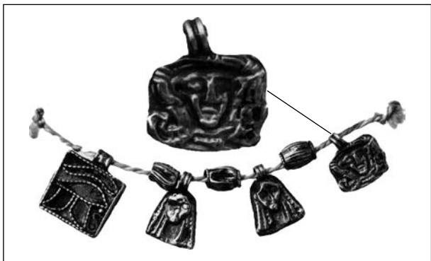
Рис. 8. Золота підвіска нагрудної прикраси із зображенням голови Хатхор (гробниця ССV некрополя II Маріона-Арсіної, Кіпр, VI—V ст. до н. е.), London BM EA 1887,0801.17