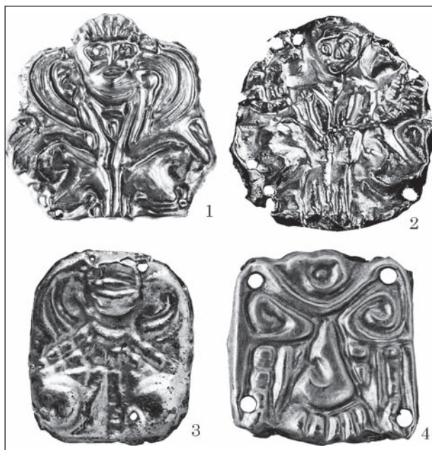
Рис. 6. Золоті пластинки-аплікації — елементи костюмних комплексів: 1 — курган 2 поблизу урочище Галущино, Черкаська обл.; 2—4 — курган 4 поблизу с. Новоселиця, Черкаська обл.

Л. В. Копейкіна також, тобто, як і А. П. Манцевич і Н. А. Онайко, підкреслила, що мотив «сфінкс з подвійним тулубом» був поширений в античному світі, а своє походження веде зі східного мистецтва (Копейкіна 1986, с. 56—57). Куль-Обські вироби — зразок трактування образу сфінкса за традиціями греко-скіфського стилю. Пластинка ажурна, вирізана за контуром зображення сфінкса з подвійним тулубом. У центрі — велика голова істоти з грубуватими рисами обличчя і зачіскою у вигляді трьох завитків. Фігури сфінксів, що сидить, передані схематично: крила, підняті вгору, загнутими кінчиками торкаються голови, невіразними рельєфними лініями показано хвости, профільна позиція ніг підкреслює особливості композиції (Онайко 1970, с. 42, рис. 9). Л. В. Копейкіна вважала, що пластинки виготовлені в боспорських майстернях. Однією з ознак виробів боспорських тореєтів була своєрідна ажурність: майстри вирізали окремі ділянки виробу, щоб яскравіше виділити контури зображення (Журавлев, Новикова, Шемаханская 2014, с. 133, кат. 33—34).