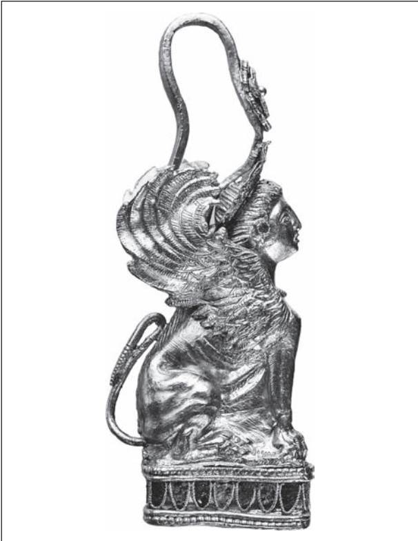
Рис. 1. Сережка із зображенням сфінкса, що сидить на постаменті (курган Старший брат з групи Трибратніх курганів (Крим))

щастя не знайшов, бо, як виявилось справдилось страшне пророцтво: Едіп убив батька і одружився на своїй матері. За уявленнями еллінів — від долі не втечеш.