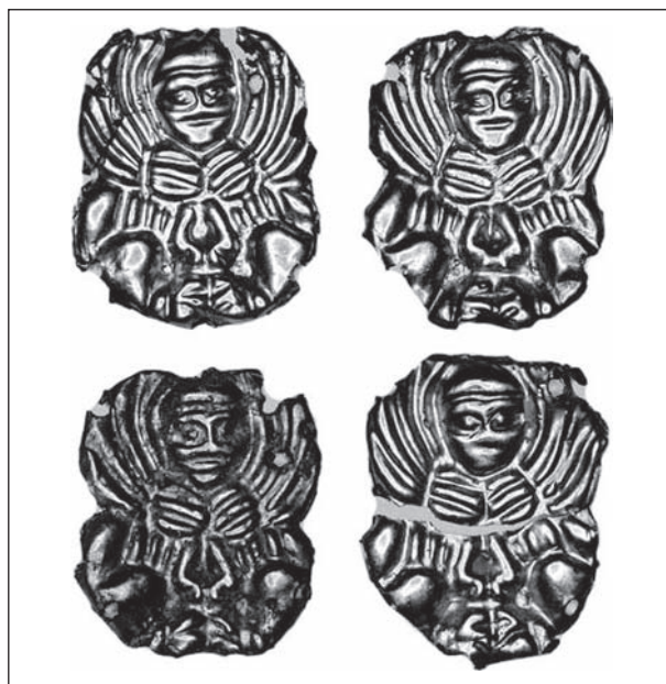
Рис. 7. Золоті аплікації із зображенням сфінкса з симетрично розгорнутим тулубом з кургану поблизу Красний Поділ, Херсонська обл.

Ще два типи стилізації образу сфінкса на золотих пластинках, зафіксовані серед апліка-