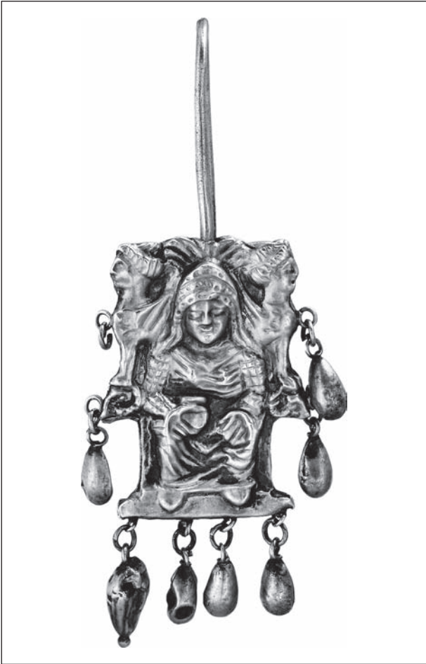
Рис. 10. Зображення богині на троні зі сфінксами обабіч (сережка з кургану 10 поблизу Велика Знам'янка, Запорізька обл.)

Криму, золоті пластинки з с. Малої Лепетихи, с. Вовчанське (рис. 5: 2). Привертає увагу зображення голови сфінкса на прикрасах із радгоспу Степовий: від скронь обабіч спускаються дві смужки (рис. 8: 1).