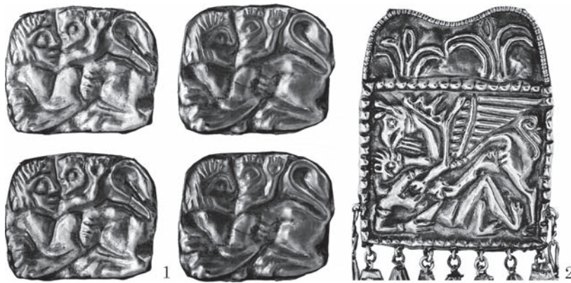
Рис. 3. Пластинки з сюжетом «боротьба людини з чудовиськом»: 1 — пластинка зі сценою боротьби людини зі сфінксом (Бердянський курган поблизу с. Нововасилівка, Запорізька обл.); 2 — зображення боротьби людини з грифоном (підвіска з кургану 4 поблизу с. Новоселиця, Черкаська обл.)

фільному ракурсі, а на ширших (24 × 24 мм) — розетки із загостреними пелюстками. Оздаба походить із Ольвії. Особливості втілення образу сфінкса та рослинного візерунка, застосування техніки скані — все це дозволяє припустити, що прикрасу створили у V ст. до н. е. (Клочко 2014, с. 113, рис. 2, 3). Схожого сфінкса (обернений обличчям праворуч), бачимо на пластинках (27—29 × 17—18 мм), знайдених у боковій гробниці в кургані Товста Могила (м. Покров, Дніпропетровської обл.) серед прикрас убрання жінки. Зображення сфінкса рельєфне, виконане в техніці витискування (Мозолевський 1979, с. 131, рис. 113: 9).