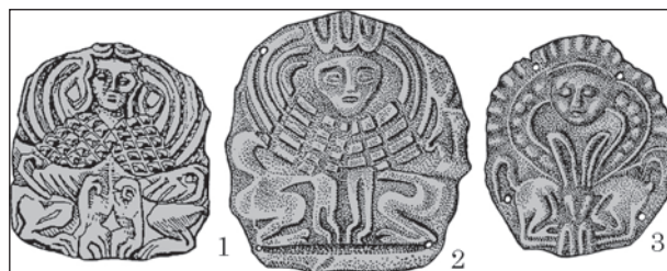
Рис. 5. Прикраси головних уборів: золоті пластинки із зображенням сфінкса з подвійним тулубом: 1 — великий курган М. Веселовського поблизу с. Мала Лепетиха, Херсонська обл.; 2—3 — курган 8 поблизу с. Вовчанське, Херсонська обл.

А. П. Манцевич зазначала, що мотив «сфінкс з подвійним тулубом» був значно поширений в античному світі (Манцевич 1987, с. 31). Дослідниця підкреслила, що майстри застосовували різні засоби стилізації при створенні образу: 1) тулуб повністю подвоєний, тому груди і лапи істоти подані в профіль, 2) подвоєння тільки