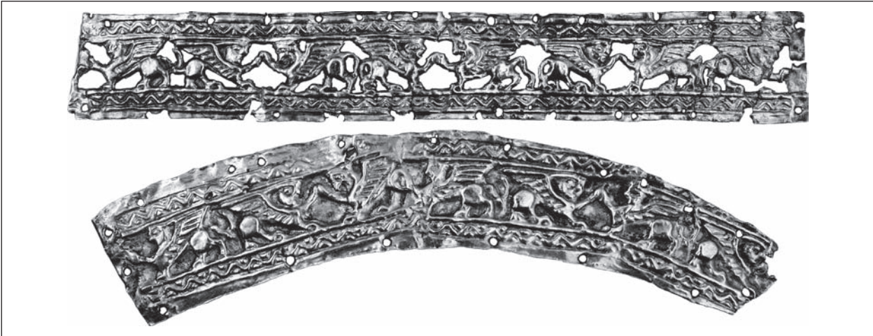
Рис. 4. Пластинки декоровані орнаментальним мотивом: сфінкс і грифон у геральдичній позиції — прикраси головних уборів (курган 22, пох. 1 поблизу с. Вільна Україна, Херсонська обл.)

з фантастичною істотою, перемога над якою символізує утвердження буття через подолання смерті.