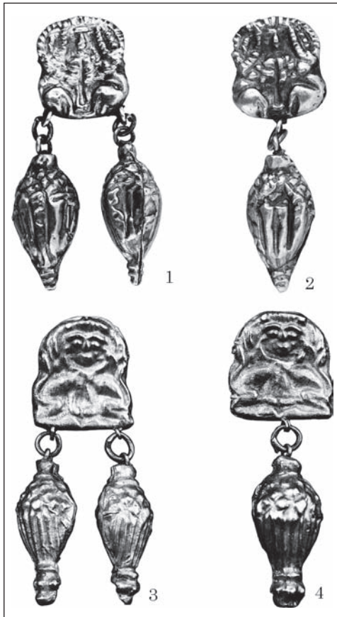
Рис. 8. Зображення сфінксів із подвійним тулубом на елементах нашійних прикрас: 1 — золоті коробчасті ланки ланцюжка з кургану поблизу радгоспу «Степовий», Запорізька обл.; 2 — деталі ланцюжка з кургану 3 (пох. 2) поблизу с. Ізобільне, Дніпропетровська обл.

підвішували за допомогою мініатюрного кільця, прикріпленого до петель — вони напаяні по одній і по дві знизу на коробчастій ланці (Клочко 2014, с. 117, рис. 4: 1, 2).