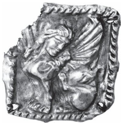
Рис. 2. Пластинка із зображенням сфінкса (Бердянський курган поблизу с. Нововасилівка, Запорізька обл.)