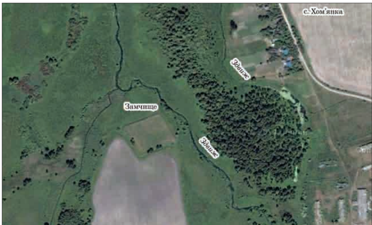
Рис. 2. Замчище поблизу с. Лазарівка на космоснімку, сучасний стан.

Вперше опис залишків замчища подав І. І. Фундуклей, цей опис далі подається в оригінальному варіанті: «В селениі Лазаревке єсть замковище, обведенне квадратным валом,