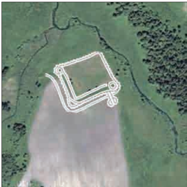
Рис. 3. Результат накладення окомірного плану пам'ятки 1989 р. на космоснімок Google Earth

С восточной и западной стороны также две стены; но без зубцов, вышиною в 1,5 сажени. С восточной стороны протекает река Здвиж, которой вода, входя в каналы, окружает весь замок» [Фундуклей, 1848, с. 40].