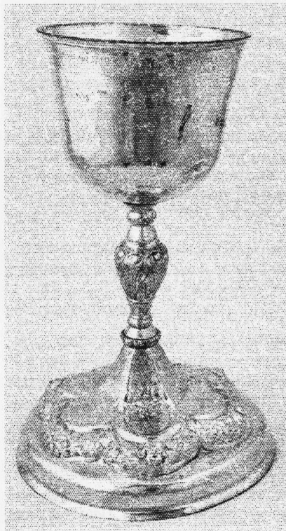
Рис. 1, ДМ-434

На дзвоноподібній чаші з профільованими вінцями вигравірувано Голгофський хрест з написом "ІС ХС", оточений лавровим вінком з вдома перехватами, який плавно облямовує частина дарчого напису, зробленого