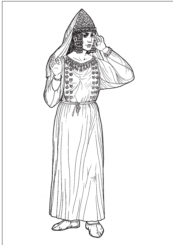
Рис. 2. Костюм скіф'янки за знахідками в кургані поблизу с. Новоселки (Черкаська обл.; IV ст. до н. е.)

Для вивчення вбрання населення Правобережної Скіфії дослідники залучають здебільшого декоративні засоби: пластинки-аплікації, сережки, різноманітні нашийні та наручні оздобы — тобто, знімні (накладні) прикраси. Застосування методики реконструкції костюмів за археологічними матеріалами дало результати: було відтворено архаїчні головні убори (курган № 100 поблизу с. Синявка, № 35 поблизу с. Бобриця, Переп'ятиха) [Клочко, 2012, с. 223—232], а також костюми IV ст. до н. е. з курганів № 4 поблизу с. Новоселки та Великому Рижанівському [Клочко, 2008, с. 23—42; 1992, с. 99; 1998, с. 139—151] (рис. 1; 2).