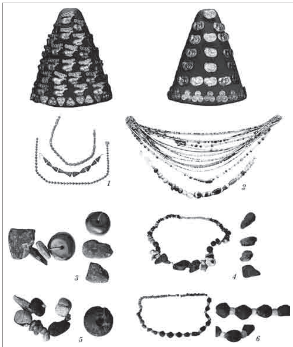
Рис. 5. Нашийні прикраси з намиста з бурштином (VII—V ст. до н. е.): 1 — низки з кургану 100 («Могила Тернівка») поблизу с. Синявка Черкаської обл.; 2 — з самоцвітів з кургану 35 поблизу с. Бобрися Черкаської обл.; 3 — курган 40 поблизу с. Гуляй Город Черкаської обл.; 4 — низка з костюмного комплексу з кургану 330 поблизу с. Гуляй Город Черкаської обл.; 5 — курган 432 поблизу с. Журавка Черкаської обл.; 6 — низка з колекції О. Бобринського (Канівський р-н Черкаської обл.)

кристалю і хризоліту; нижня — 40 екземплярів різноколіорового каміння, серед яких — 2 великих бурштинових намистини (у формі неправильної зрізаної пірамідки) [Бобринский, 1887, табл. XVIII; 1894, табл. XXI, 1]. У могилі поховали ще одну жінку, убір якої прикрашали бронзові цвяхоподібні сережки та шпильки. Біля лівої руки покійниці поклали блюдо, під нього — довгу низку, яка включала, крім чорного та білого намиста зі склоподібної маси, ще 125 бурштинових кулястих дрібних намистин [Бобринский, 1887, табл. XVIII, 7; 1894, табл. XXI, 1] (рис. 5, 2). Зі звітної документації відомо, що бурштинові вироби були серед знахідок у кургані Переп'ятиха. Йдеться про бурштинові намистини та фрагмент пластинки, яку, можливо, використовували як вставку [Скорий, 1990, с. 34, рис. 5, 18]. Цей курган є «усипальницею одного з могутніх скіфських вождів», похованого з супровідними особами, серед яких були скіфи-іранці та представники місцевих племен [Скорий, 1990, с. 94].