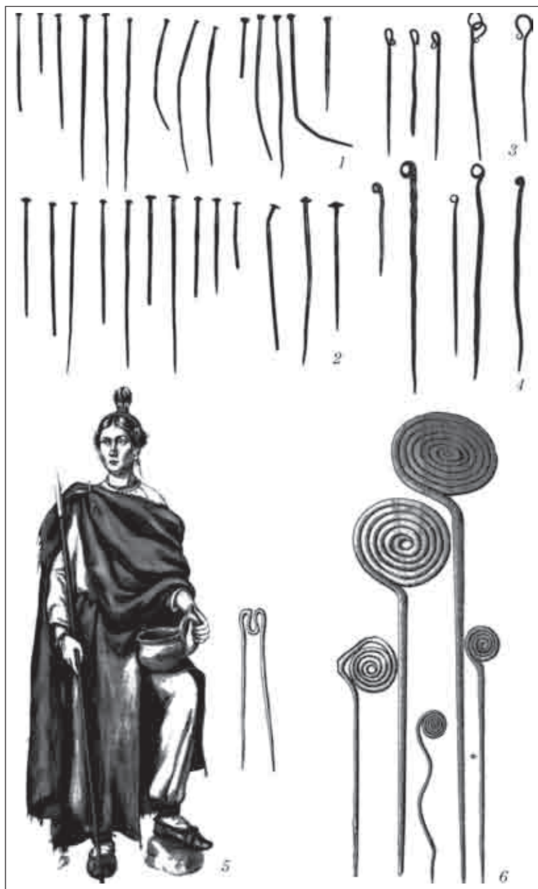
Рис. 6. Шпильки з костюмних комплексів Лісостепоного Правобережжя (VII—V ст. до н. е.): 1 — цвяхоподібні, з пам'яток Дніпровського Правобережжя; 2 — варіанти оформлення цвяхоподібних шпильок: грибоподібні, конічні, біконічні голівки; 3 — з петлеподібними наверхниками (Канівський повіт; с. Пекарі, колекція Кундеревича; з околиць Ржищева); 4 — посохоподібні; 5 — реконструкція зачіски, створеної із застосуванням двострижневих шпильок (автор З. Васіна); 6 — зі спіралеподібним навершям; курган 136 Тенетинківського могильника «А»; к. 1 поблизу с. Раковкат; Жаботин, поселення; Пастирське городище; к. 3, Братишов

У Дніпровському Правобережжі за підрахунками В.Г. Петренка знайдено половину від усієї кількості шпильок, що були у вжитку в Скіфії. В.Г. Петренко виділила 30 типів, зазначивши, що початкові форми слід шукати у культурах