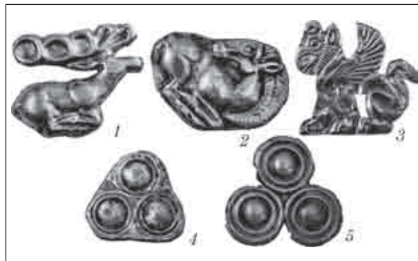
Рис. 3. Пластинки — аплікації — оздоба архаїчних головних уборів з курганів Лісостепового Правобережжя (VII—VI ст. до н. е.): 1, 4 — з кургану 100 («Могила Тернівка») поблизу с. Синявка Черкаської обл.; 2, 5 — з кургану 35 поблизу с. Бобріця Черкаської обл.; 3 — із зображенням грифона (курган Переп'ятиха)

Сережки. За доби скіфської архаїки на землях Дніпровського Правобережжя та Західного Поділля були поширені так звані цвяхоподібні сережки (чи завушниці) — вироби, що нагадують перекручений у формі S або дугоподібно зігнутий гвіздок з пласкою чи опуклою шлямкою. Польські археологи аналізували аналогічні сережки, знайдені серед пам'яток лужицької культури. Походження завушниць — питання, яке в тому чи іншому контексті висвітлювали Т. Сулімірський, К. Москва, М. Душек, М. Пардуц, А.І. Мелюкова [Sulimirski, 1936; Moskwa, 1963, s. 253—259]. Висновки науковців збігаються: гвіздки підвіски виникли під впливом скіфських зразків, а деякі екземпляри є імпортованими зі Скіфії [Bukowski, 1960, p. 70—72]. В.Г. Петренко виділила 5 типів цвяхоподібних сережок, але висновки про їх походження досить суперечливі. В.Г. Петренко розглянула