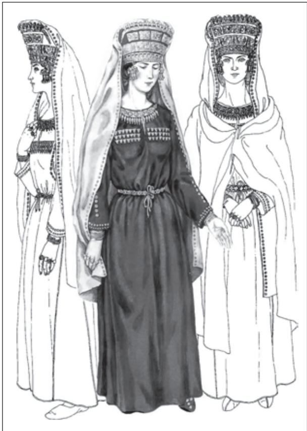
Рис. 1. Реконструкція костюма скіф'янки за матеріалами дослідження Великого Рижанівського кургану (Черкаська обл.; IV ст. до н. е.)