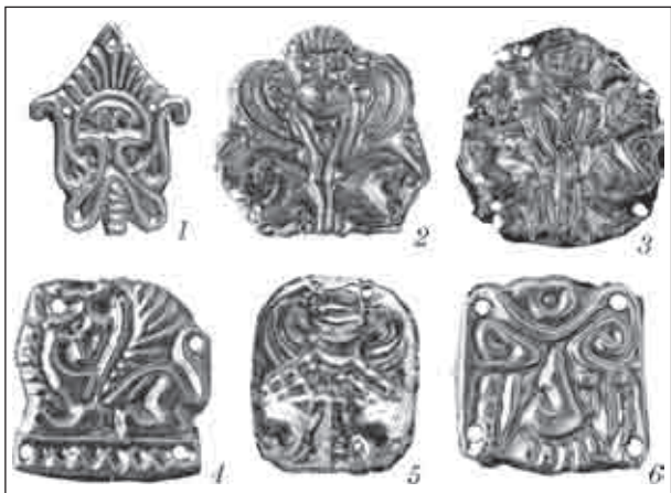
Рис. 8. Золоті пластинки — прикраси головних уборів та одягу — з курганів Лісостепоного Правобережжя (V—IV ст. до н. е.): 1, 3—6 — елементи декору костюма скіф'янки з кургану 4 поблизу с. Новоселки Черкаської обл.; 2 — з рельєфним зображенням сфінкса з подвійним тулубом з кургану 2, уроч. Галушине поблизу с. Пастирське Черкаської обл.

індоевропейських народів. Ідею відродження уособлюють і пагони рослин, вміщені у верхній (фігурній) частині основної деталі підвісок — по два на кожній пластинці (зображення рослин за абрисом схожі на крин). У передачі мотивів і образів — відображення своєрідності художнього стилю, який вирізняє вироби місцевих майстрів. Серед їхніх витворів і оздоба начільної стрічки скіф'янки — золота видовжена прямокутна смужка (довжина 24, ширина 2,5 см), так звана «метопіда». Поверхня смужки традиційно розділена на дві частини. Верхній фриз — ритмічний ряд стилізованих зображень лосиних голів, обернених вліво. Художник відтворив видові ознаки тварини: характерні контури рогів, горбоносу морду. Це унікальний орнамент, створений з дотриманням принципів звириного стилю. Нижній ярус на стрічці — традиційна смуга з овів та напівовів, нанесених трьома тоненькими рельєфними лініями.