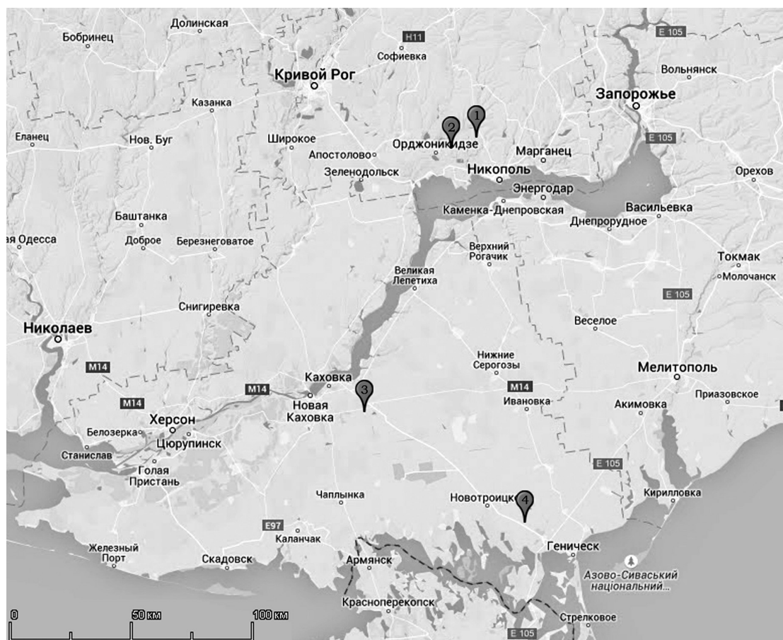
Рис. 2. Карта розташування курганів: 1 – Чортомлик; 2 – Товста Могила; 3 – Червоний Перекоп курган; 4 – Водославка курган

На нашу думку, у випадку з довгими пластинами одягу першочерговим є символізм загальної композиції, а не окремих її персонажів. У такому разі комахи та птахи виступають як супутники світового дерева. Воно було символом богині-матері